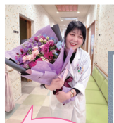
職員さん、ありがとうございます!