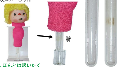
「私、ほんとは吸いたくないんだけど、ゲホ…」